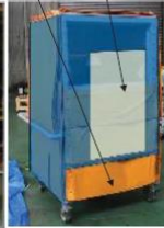
可動式遮 へい台車