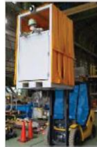
高所作業 遮へい台車