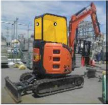
遮へい重機 (バックホウ)