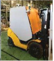
遮へい フォークリフト