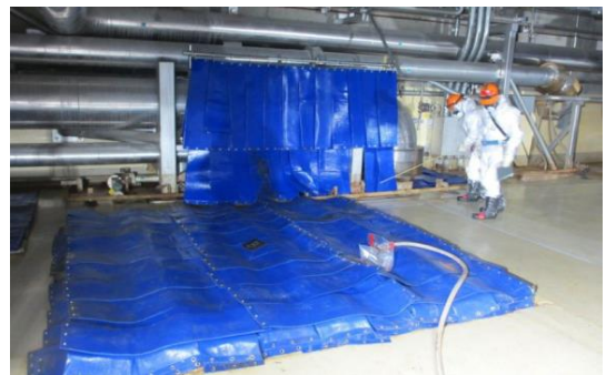
図の遮へいは複数社による設置分を含む